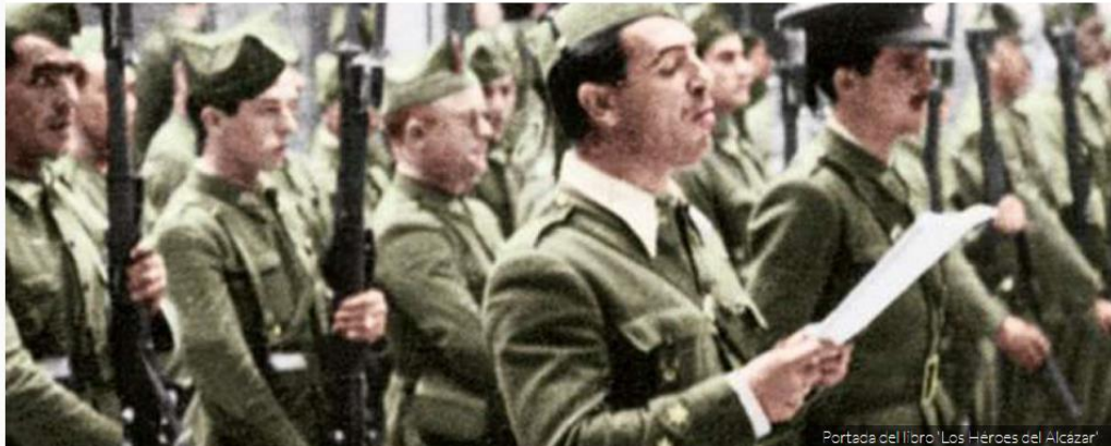
Portada del libro 'Los Héroes del Alcázar'