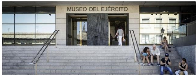
Facahada del Museo del Ejército

La presentación del libro 'Los héroes del Alcázar' que iba a presentarse en el Museo del Ejército el viernes ha sido cancelada. La cancelación llega después de que IU elevara al Congreso una pregunta al Gobierno sobre si había autorizado el acto